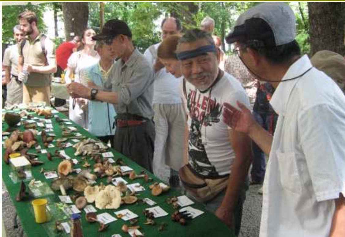
Gosti iz Japana sa interesovanjem razgledaju izložene gljive

Razvio se živ razgovor i direktno, na engleskom jeziku, ali i preko prevodioca, studentkinje japanskog jezika koja im je pomagala da se lakše snadju u Beogradu. Vodja grupe, koji se predstavio kao Tac, objasnio mi je da se radi o grupi Japanaca prosečne starosti od 66 godina (a jedan je bio i u specijalnim invalidskim kolicima), koji putuju od grada Xi'ana u Kini do Rima u Italiji, u 20 deonica, pri čemu je ovo 19. put a putuju od Beograda do Zagreba. Zatim mi je dao letak sa tim informacijama koji je skeniran i nalazi se na priloženoj slici.